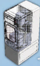
← 2D/3D CAD 繪圖/機構設計